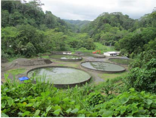
写真.アラオア浄水場

今回の調査では、首都アピア近郊に再生可能エネルギーの適用可能性の調査と、宮古島市が適用し、サモア国に技術移転した水処理方法「生物浄化法」について、サモア国での適用条件を検証する業務を行いました。