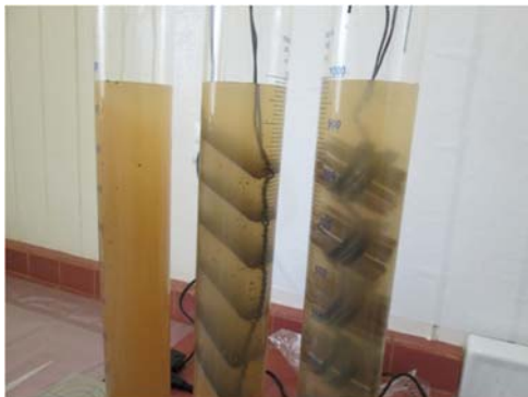
写真.濁水の沈降試験

試験の結果、年中気温の高いサモア国では生物活性が高いため、砂ろ過池のろ過速度を20m/d(日本の指針は3~5m/d)でも試験期間中は安定的に浄水することができました。今回の試験結果は、サモア国でのろ過速度を決定するための有意義な試験となりました。他にも濁水の沈降試験や取水地点~浄水場予定地、ポンプ場の予備調査を行いました。