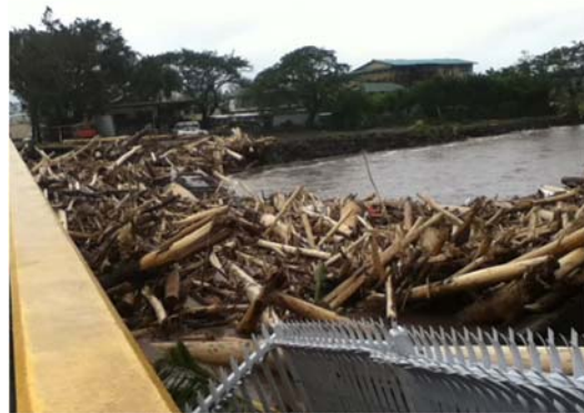
写真.サイクロン被害

しかし、1回目の調査(12月)では、サイクロンの襲来を受け首都アピア市内で都市機能がマヒするほど被害を受けたため、やむなく調査を中止し、2013年1月26日~2月9日の日程で2回目の調査を行いました。