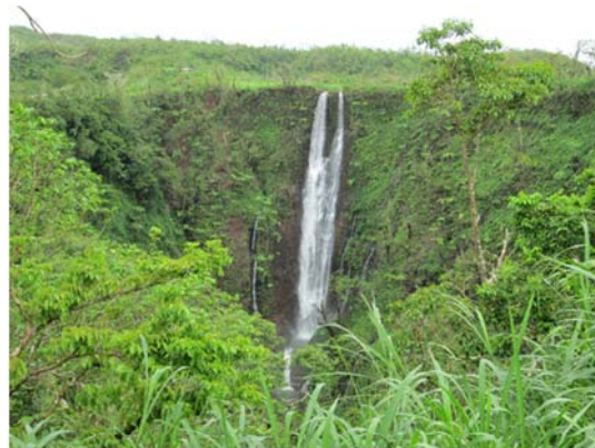
写真. Papapaitai 滝