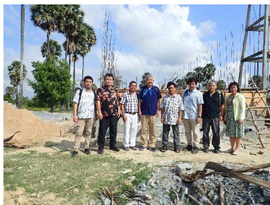
建設中の施設の前で集合写真