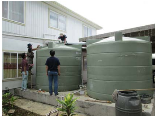
写真.天水タンク (FRP 製)

地下水の透明度は高く、目視では濁り成分は見られませんでした。日本の JICA からの援助により地方水道の高架タンクが建設されていました。