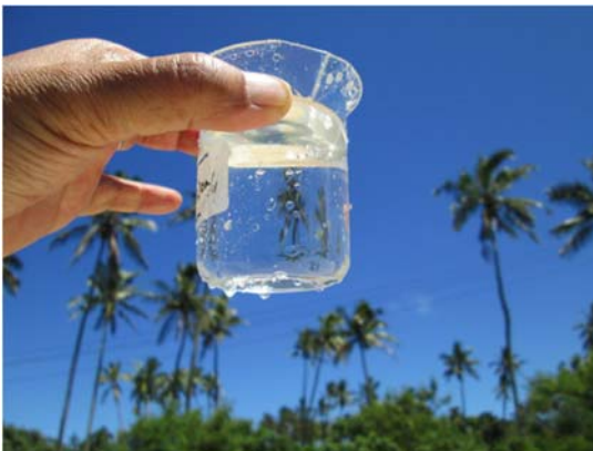
写真.地下水 透明度が高い

地下水の透明度は高く、目視では濁り成分は見られませんでした。日本の JICA からの援助により地方水道の高架タンクが建設されていました。