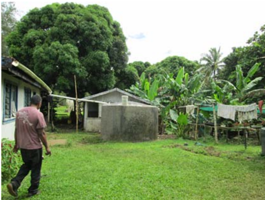
写真.天水タンク (コンクリート製)

トンガ水道局 (TWB) は首都の都市部のみの水道を管轄しており、他の地域では集落の区長が水道を管理しています。地方でも地下水の硬度は高く、住民は住宅の屋根から天水を集め生活用水として利用しています。ほとんどの家の庭先には大きな水タンクを設置しており、天水の利用度が高い国となっています。