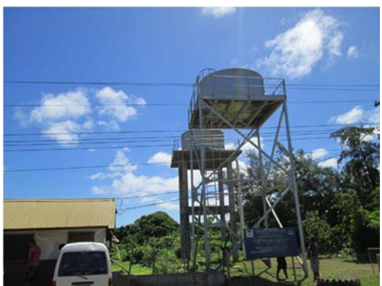
写真.日本の援助による高架タンク