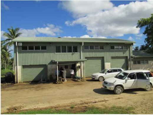
写真.井戸群管理棟