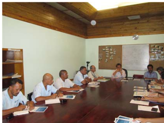
写真. トンガ水道局との調整

今回の業務では、現状把握のための現地調査と、トンガ水道局 (TWB) からの資料収集が目的でした。水道水は地下水を多数のポンプで汲み上げ、塩素消毒後、配水していますが硬度が高いため水道水の評判はあまり良くありません。また、地下水の過剰揚水によりバランスが崩れ淡水レンズの塩水化が懸念されています。実際、電気伝導度、全硬度の簡易試験を行ったところ、沖縄県と比較しても高い値を示しました。