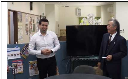
ワシーム（シリア人）

シリア料理の材料は日本で手に入るとのことなので、今度、彼の家でシリア料理教室を開き、異文化交流を行う計画を立てています。（このコロナ騒動でいつになるか分かりませんが。。。）