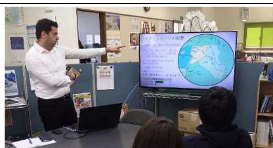
シリアの説明（日本語）